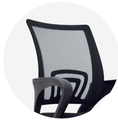
Espaldar en malla