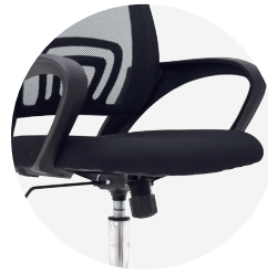
Espuma laminada y tapizada