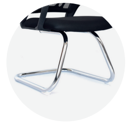
Base cromada trineo