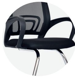
Espuma laminada y tapizada