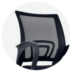
Espaldar en malla