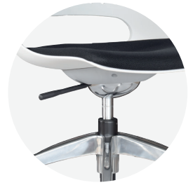
Mecanismo semireclinable a 90°