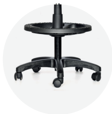
Aro apoyapiés Nylon o cromado