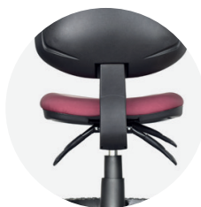
Mecanismo Up and Down 2 ó 3 palancas