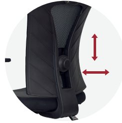
Soporte lumbar regulable.