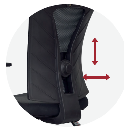
Soporte lumbar regulable.