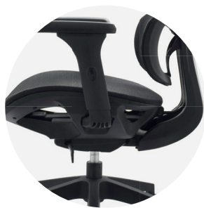
Mecanismo syncro 4 bloqueos.