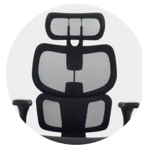
Espaldar en malla Nylon.