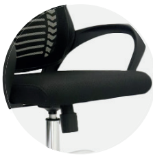
Asiento en espuma laminada