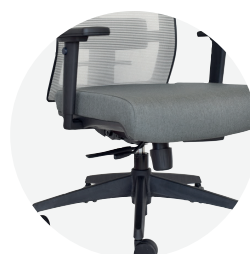
Asiento en espuma inyectada regulable en profundidad (slider)