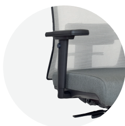
Brazo regulable 3D