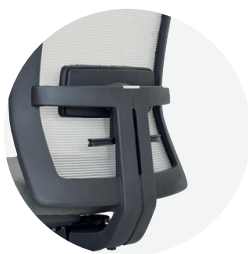
Apoyo lumbar regulable en altura