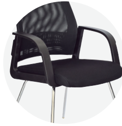
Asiento en paño