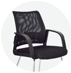
Estructura En pp