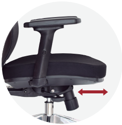
Asiento laminado con slider