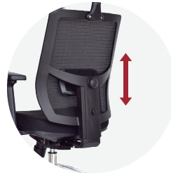
Espaldar alto regulable en altura