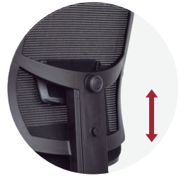
Soporte lumbar en altura y profundidad