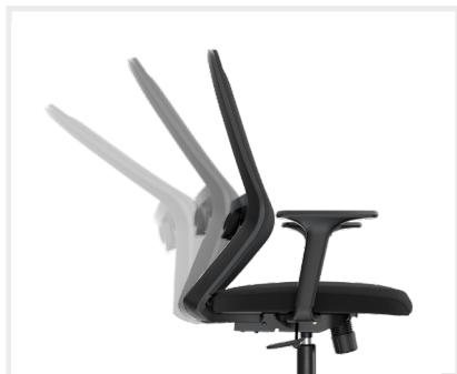
MECANISMO Syncro con 1 o 3 bloqueos.