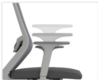
BRAZOS Regulable en altura.