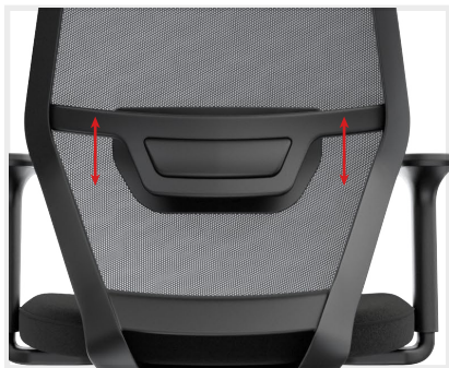
APOYO LUMBAR Regulable en altura.