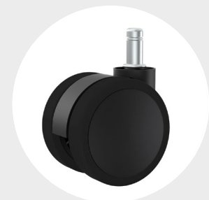
Ruedas goma (PU)