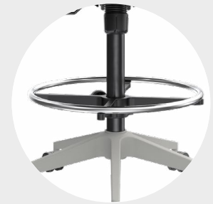
Aro nylon negro o cromado